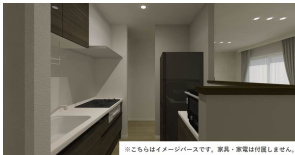
※こちらはイメージ画像です。実際・家電は付属しません。