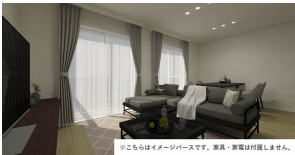
※こちらはイメージ画像です。実際・家電は付属しません。