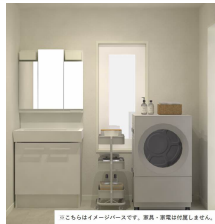
※こちらはイメージ画像です。実際・家電は付属しません。