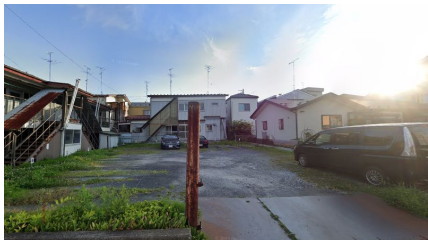
北川駐車場 配置図